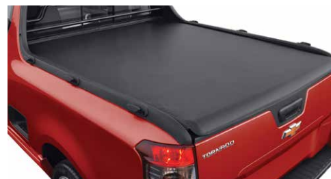
Cubierta suave para caja

Pregunta a tu Distribuidor por los accesorios disponibles y personaliza tu Chevrolet Tornado® 2019 de acuerdo a tus necesidades.